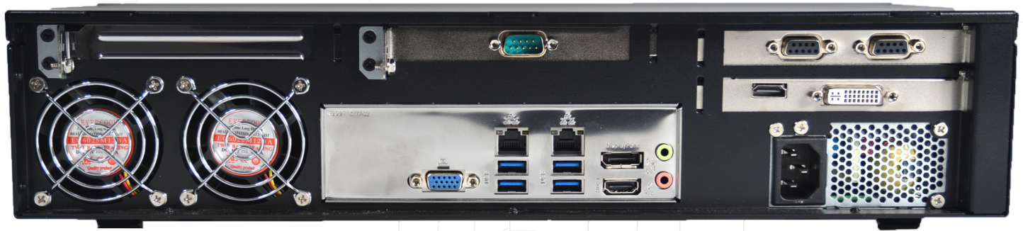
Image de la face arrière